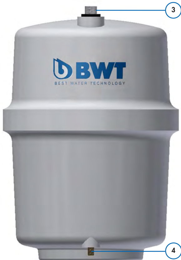
Рис. 2: Коннектор для создания давления воздухом на объем чистой воды