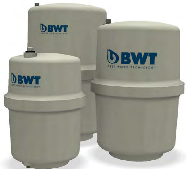
Рис. 3: Типы / размеры комплектов накопительных баков BWT: 7л, 11л, 19л