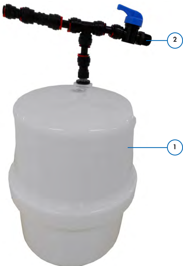
Рис. 1: BWT Накопительный бак, комплект (Пластиковый напорный бак и собранный соединительный комплект подключения для чистой воды)